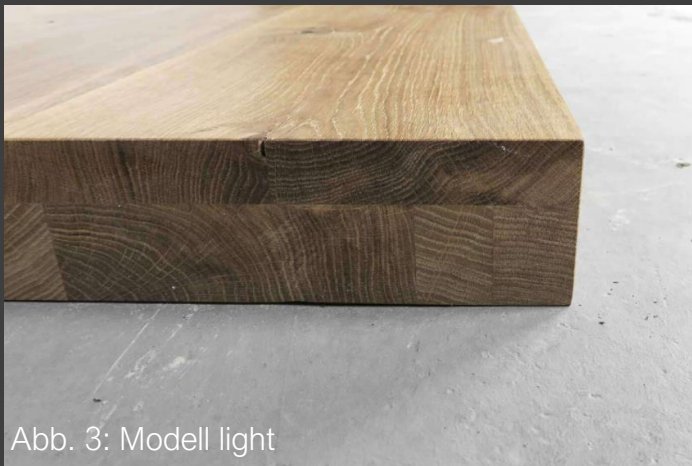
Abb. 3: Modell light

Hierbei handelt es sich um eine aufgedoppelte Tischplatte. Im Gegensatz zu vollmassiven Tischplatten sind diese im Kern dünner gearbeitet und die Ränder der Tischplatte werden auf die doppelte Materialstärke verleimt. Neben der Kostenersparnis kann so auch Gewicht reduziert werden und die Stärke flexibel bestimmt werden. Da einige Tischbeine und -gestelle eine Beschränkung bzgl. der maximalen Belastung haben, steht einem bei einer gedoppelten Echtholzplatte eine größere Auswahl an Tischgestellen zur Verfügung.