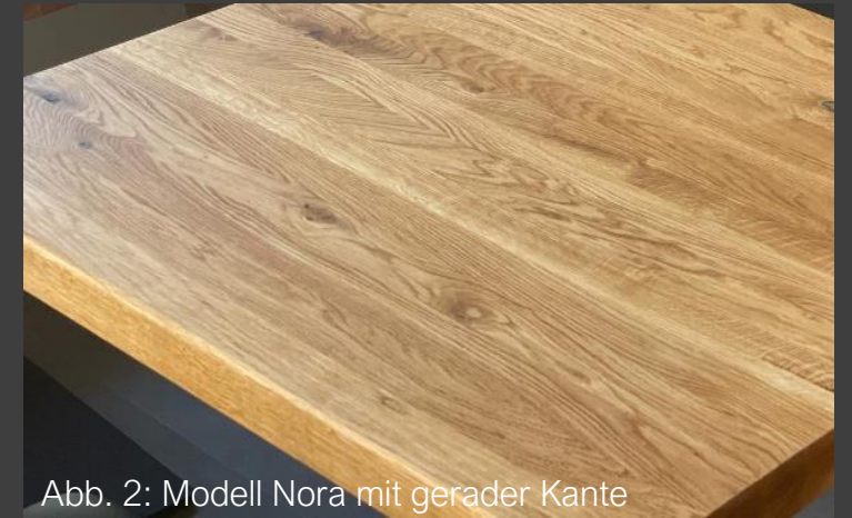
Abb. 2: Modell Nora mit gerader Kante

Dieses Modell aus massiver Eiche Leimholzplatte besticht durch seine Resistenz und Widerstandsfähigkeit. Leimholzplatten sind einlagige Massivholzplatten, deren Holzleisten verleimt werden.