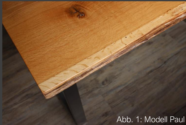
Abb. 1: Modell Paul

Dank seiner Tischplatte aus Massivholz ist dieser Tisch besonders ausdrucksstark und verbreitet ein natürliches Flair. Um der massiven Holztischplatte den individuellen, authentischen Look zu verleihen, durchläuft sie mehrere aufwendige Arbeitsschritte in der Fertigung. Die Struktur und der Verlauf des Holzes können hierbei z. B. durch Lack dezent betont werden, wodurch die Oberfläche zudem geschützt wird. Durch die organische Baumkante ist jedes Möbelstück ein echtes Unikat.